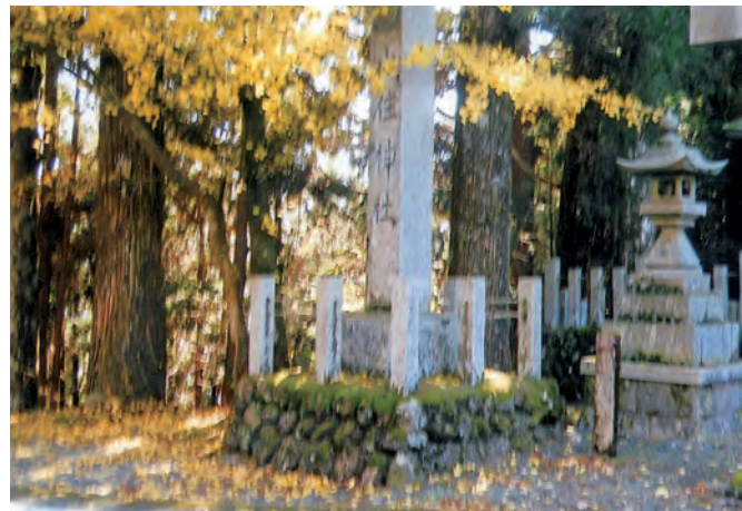
山住神社 山住神社の社号