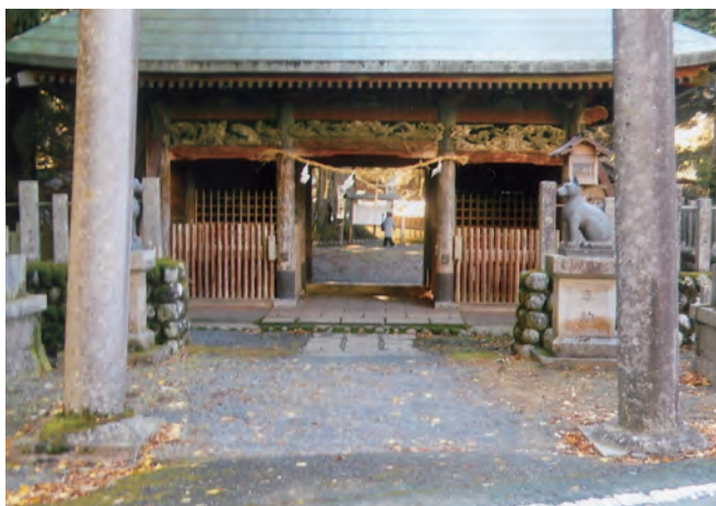
300年以上の山住神社(社殿)