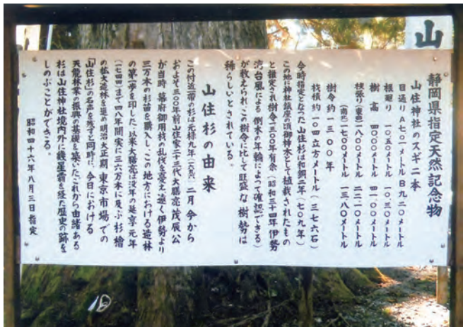
指定天然記念物の山住神社のスギ2本説明看板