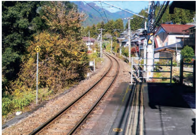
JR 飯田線 向市場駅