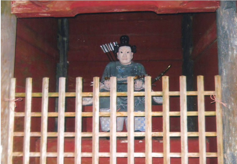
山住神社入口の仁王門(右) 右と左に構えて神社を守っています