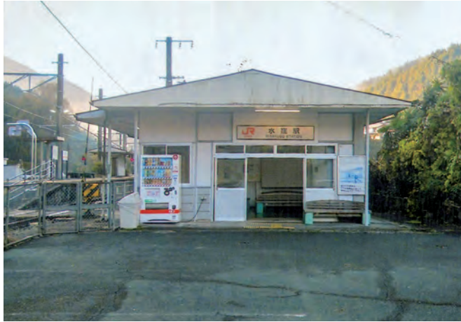
JR 飯田線 水窪駅 水窪町全域が見渡せる高台にある