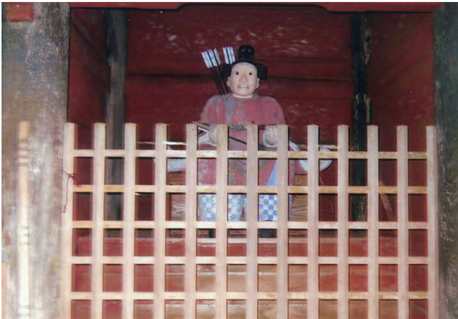
山住神社入口の仁王門(左)