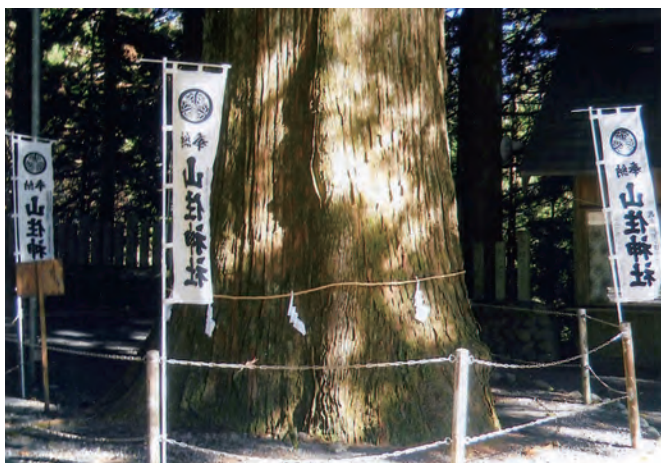
山住神社の杉 樹齢約 1,300 年