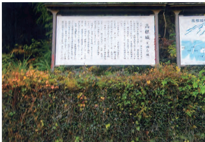
高根城の説明看板